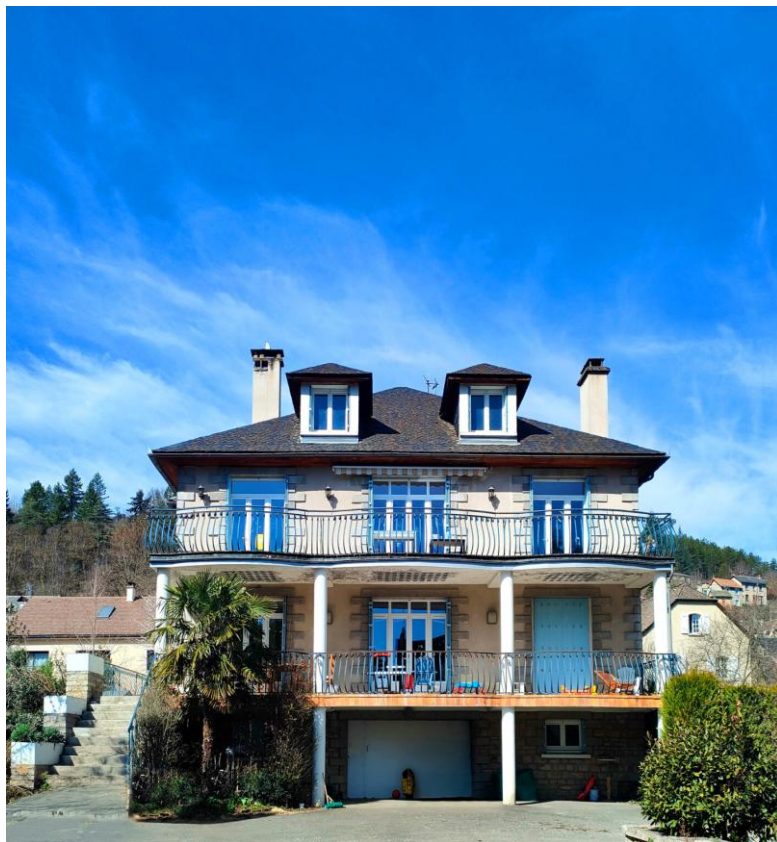
a. Environnement scolaire

Le territoire offre un maillage de partenaires diversifiés, permettant de soutenir la mise en œuvre des projets personnalisés des jeunes et de favoriser leur inclusion sociale, scolaire et professionnelle.